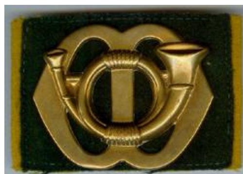
Baret embleem Garde Jagers.