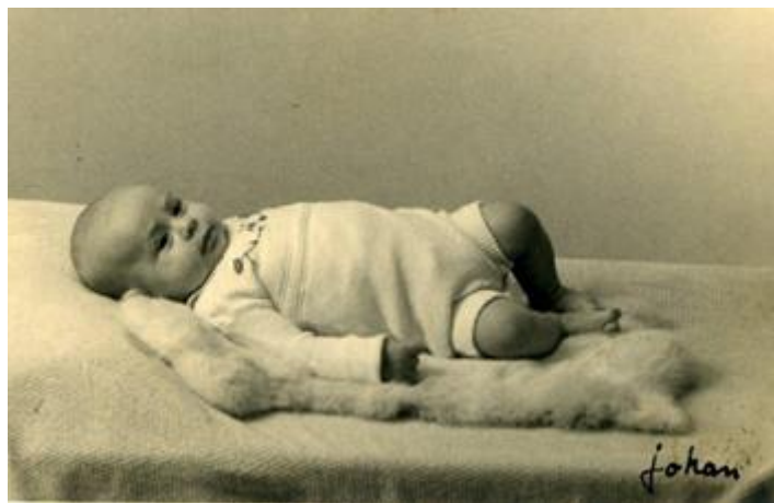
Meestal lag ik wat voor me uit te dromen.

Dit verhaal begint op een vroege maandagmorgen 24 januari 1944 in het Overijsselse Nijverdal. Het is nog oorlog en overal in Nederland zijn de woningen met dik donkerblauw of zwart papier verduisterd. Nergens komt een lichtstraal naar buiten. Straatlantarens branden niet. De bezetter heeft een avondklok van 24.00 tot 04.00 ingesteld. Tijdens die spertijd ligt het openbare leven vrijwel volledig stil. Op deze januarimorgen begint het rond 07.30 uur licht te worden. Het zal een winderige, koude en vooral sombere dag worden in Nijverdal. Maar niet bij de familie Scholten. Bij het krieken van de dag zijn daar plots de vreugdekreten van een baby te horen. De nieuwe wereldburger heeft geen klap voor zijn blote billetjes nodig om de eerste lucht in en uit zijn longen te persen en de wereld kond te doen van zijn aanwezigheid. Nee, de knaap (het blijkt een jongen te zijn) doet dat helemaal op eigen gelegenheid. Hij zal de familie in latere jaren nog wel meer staaltjes van ondernemingsdrang laten zien.