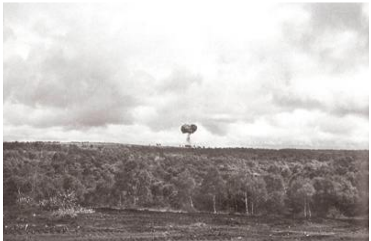
Gesimuleerde atoombomexplosie.

Dat kwam ten eerste omdat ik bonje had met vaandrig Lambiek. Ik had hem verteld dat hij niet mijn baas was. Ten tweede begon kapitein Luchsinger een beetje raar te doen, nadat ik hem vertelde: " Ik ben je dienstmaagdje niet " toen hij zijn schoenen