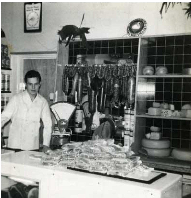
1962. Op zaterdag stond ik achter de vleeswarentonbank vlees en kaas af te snijden.

Je was in die tijd leerplichtig tot je vijftiende en dan had je acht klassen onderwijs gevolgd. Daarna mocht je doorleren als je ouders dat voor je in petto hadden. Of moest je gaan werken. In een gezin met 13 kinderen is er weinig financiële ruimte om alle kinderen te laten doorleren. Er vindt een zogenaamde “natuurlijke selectie” plaats. Bij zo’n uitdrukking denk je meestal dat juist de slimme kinderen mogen doorleren en de anderen gelijk een vak geleerd krijgen. Maar hier betekent “natuurlijke selectie”, dat de oudste kinderen automatisch na de leerplicht van school gaan en gaan werken. En pas later, als er minder kinderen op het gezinsbudget drukken, de overblijvende kinderen bij gebleken geschiktheid mogen doorleren. In een gezin met veel kinderen blijkt opvallend vaak, dat alleen de jongere kinderen mogelijkheden hebben gekregen om zich te ontwikkelen.