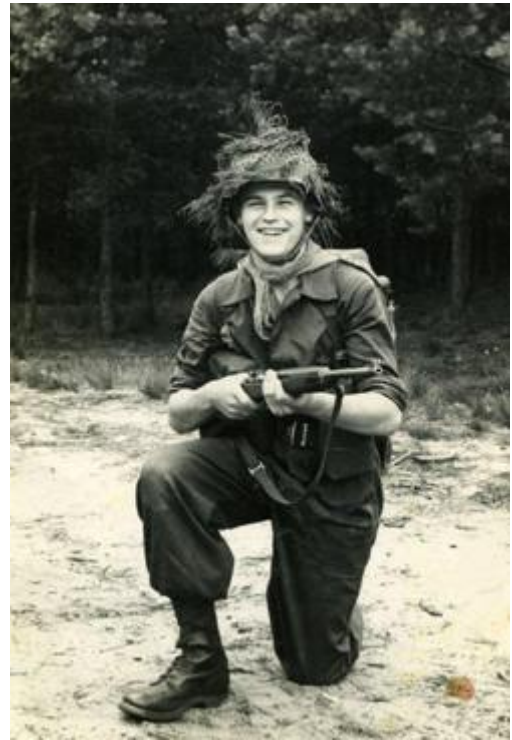
In de basisopleiding met mijn opgeboorde Winchester M-1 Karabijn. Nooit gedacht dat ik er in Australië weer mee zou schieten.