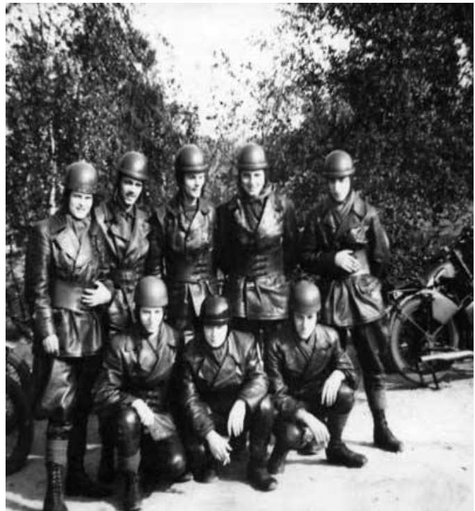
Geslaagdenklas van de opleiding motor ordonnans 63-3.

Nu hadden ze in het leger een hele makkelijke manier van lesgeven in auto- en motorrijden: wist je hoe je een voertuig moest starten, dan was je al bijna geslaagd voor het rijbewijs. En als je dan ook nog wist hoe je zo'n voertuig in de versnelling kon zetten, kon je al bijna niet meer zakken. Ik ging met een Jeep rondjes rijden in Arnhem, toen ik daar schadevrij weer uit kwam, had ik al bijna het rijbewijs binnen. Daarna een paar