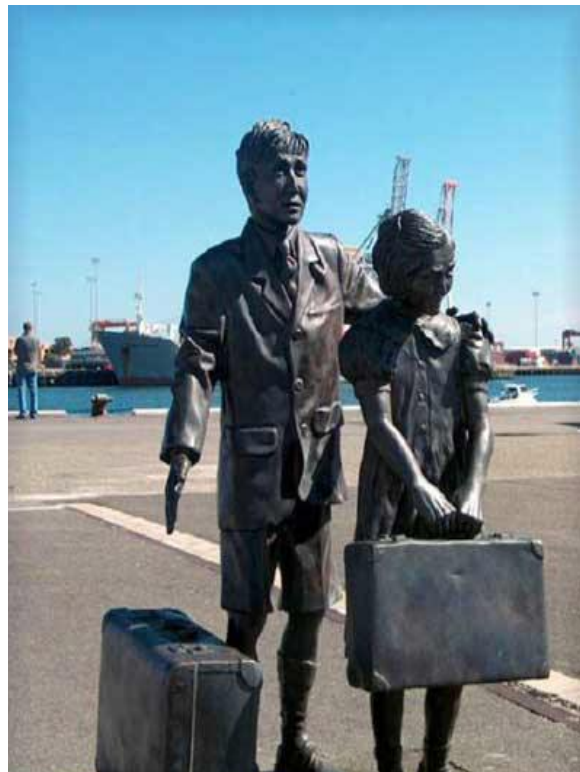
Fremantle Australië. Eerbetoen aan emigranten die vaak berooid aankwamen.

Precies het zelfde met Louis Boom. Wat die broers gepresteerd hebben met de zaak van hun vader daar neem ik mijn pet voor af: http://www.boomtransport.nl/site/nl/index.htm